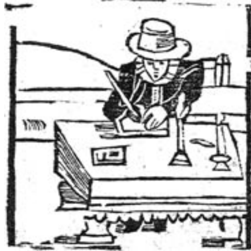
Jarfke als schrijver van profetieën, afgebeeld op het titelblad van een Groningse druk uit 1732 (UB Göttingen).