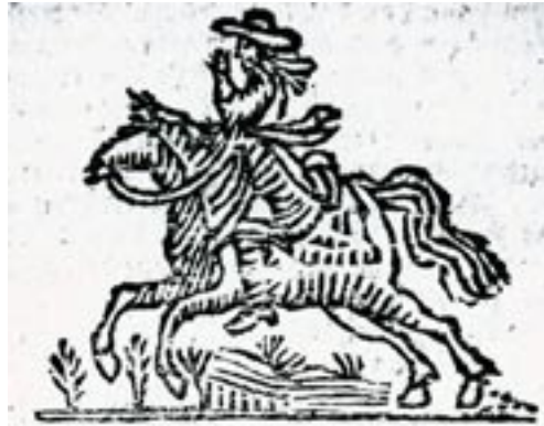
Graaf Edzard de Grote van Oost-Friesland, uit een Groningse druk van de Prophecye van Jarfke (ca. 1795). De houtsnede is mogelijk ontleend aan de aankondiging van een paardenmarkt (Fransema Kabinet).

Daar staat een kruys in 't Graven Land / en dat zal gezet worden te Embden op de Muyre en zoo dat kruys uytwaarts valt [lees: als de graaf uit de stad verjaagd wordt] / zoo zullense uyt het Land verjaagd worden / en zoo dat Kruys inwards vald / zoo zal dat volck uyt het Nederland niet verjaagd worden.