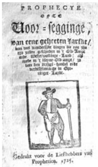
Titelblad van de oudste bewaarde druk van De prophecy van Jarfke uit 1725 (Fürstlich Wiedisches Archiv).

te werken), maar in de praktijk bleken de nieuwe polders minstens zo vruchtbaar als het oude land, terwijl de turfverkoop uit de venen langzaam op gang begon te komen. 29 De Oldambtster boeren verzetten zich weliswaar heftig tegen de beperkingen die de stad Groningen hun probeerde op te leggen, maar in de praktijk maakten ze in hun eigen dorpen