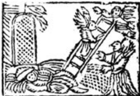
Jarfke's sterfbed, uit een Groningse druk van omstreeks 1795. De houtsnede is ontleend aan Jacob's droom in Genesis 28. Hij onderstreept dat Jarfke's profetie door goddelijke inspiratie tot stand zou zijn gekomen (Fransema Kabinet).

slaapgelegenheid vonden, zelfs als zijn eigen kinderen daardoor op een bank of op de vloer moesten slapen.