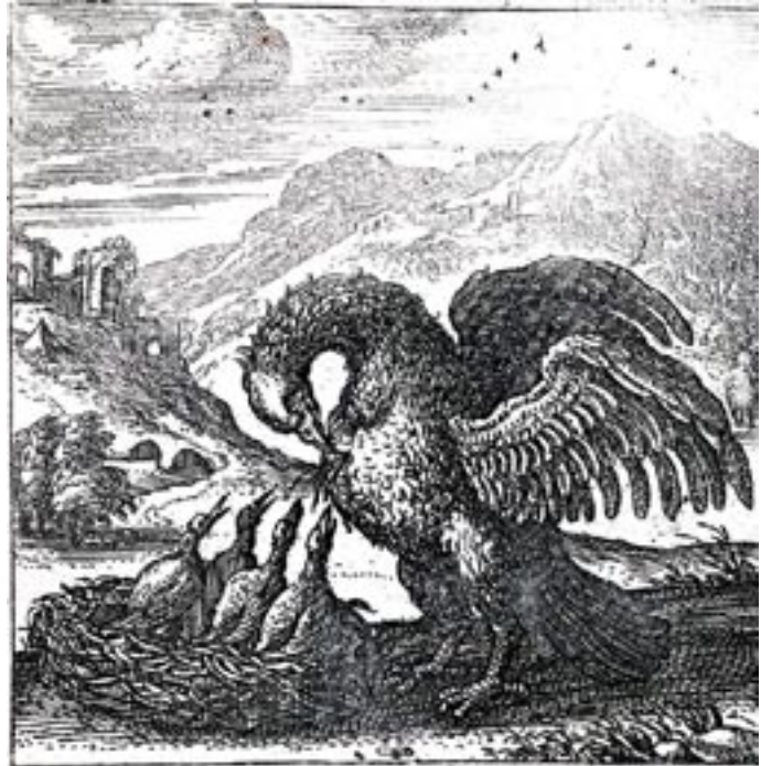
Volgens het middeleeuwse geschrift Physiologus wekte de pelikaan zijn jongen met zijn eigen bloed tot leven. Gravure door Pieter van der Borcht in een uitgave uit Antwerpen 1588.

wel degelijk in de lijn van de Reformatie. Zo ging het op veel plaatsen elders in het bisdom Münster, zo ging het ook hier. Deze geestelijken waren in de meeste gevallen goed geschoold, typische vertegenwoordigers van de Renaissance, die de nieuwste intellectuele modes bij hun parochianen introduceerden.