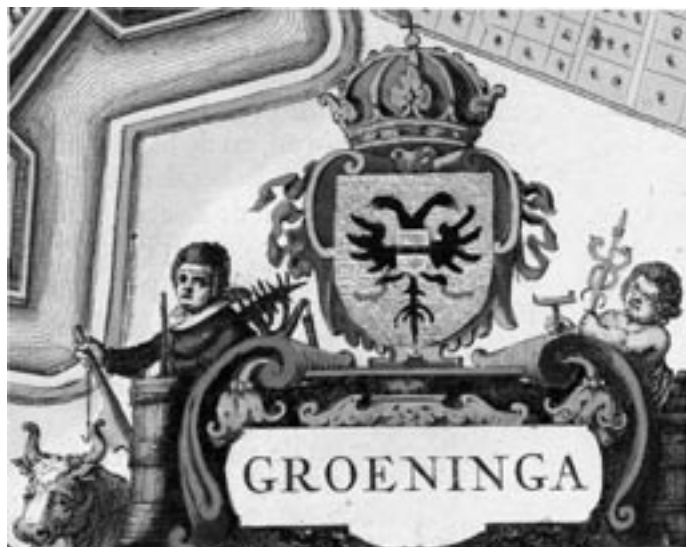
De dubbele adelaar in het wapen van de stad Groningen was tevens het symbool voor de macht van keizer Karel V en zijn zoon Philips II. Hier naar de stadsplattegrond van Egbert Hauboys, 1640.

als het ware de machtsgreep van de Emdener calvinisten in 1595.