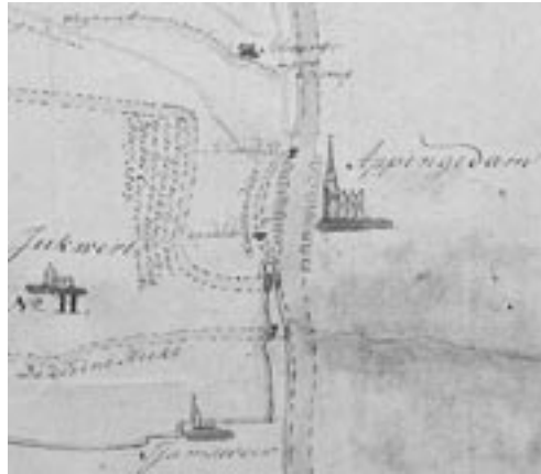
Gedeelte van een kaart van de waterstaatkundige situatie ten noorden van het Damsterdiep, 1800. De kaart weerspiegelt vermoedelijk de situatie in de tweede helft van de zeventiende eeuw (UB Groningen).

Veel duidelijker vinden we de Oude Heekt in de ondergrond terug. Hij ontsprong wellicht in de omgeving van het Hoeksmeer; vanaf Garreweer is de loop duidelijk te volgen tot het punt waar hij om De wierde slingert. Daarna verdwijnt het spoor in het niemandsland ten zuiden van de stad. Opvallend is nu dat het Kattendiep in de vijftiende eeuw ook Heeck of Olde Graft wordt genoemd. Dat is geen toeval. Ik ga ervan uit dat de Oude Heekt zich aanvankelijk met een grote bocht in het Kattendiep voortzette. De Broerstraat lag aan de buitenkant van deze meander, het latere Sint-Anthoniegasthuis daarbinnen. De uitmonding van de Heekt raakte waarschijnlijk verstopt, nadat in 1444 een dwarsverbinding met het Damsterdiep tot stand kwam. Dat verklaart ook waarom men